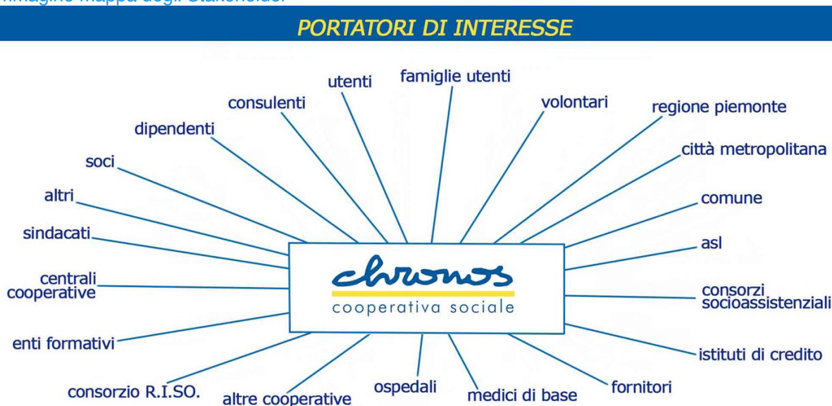
Immagine mappa degli Stakeholder

Qualunque dipendente o soggetto terzo che rappresenti la Cooperativa non è autorizzato ad accettare qualsiasi forma di dono (eccedente i modici valori) o favoritismo da parte dei funzionari pubblici, ed è tenuto a segnalarlo alla Direzione.